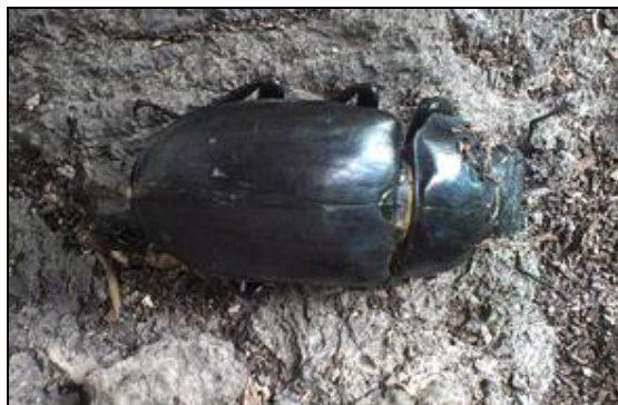
Obr. 2. Samice Lucanus cervus cervus