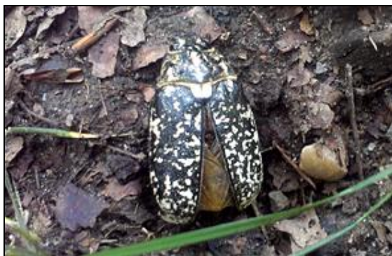
Obr. 5. Samice Polyphylla fullo