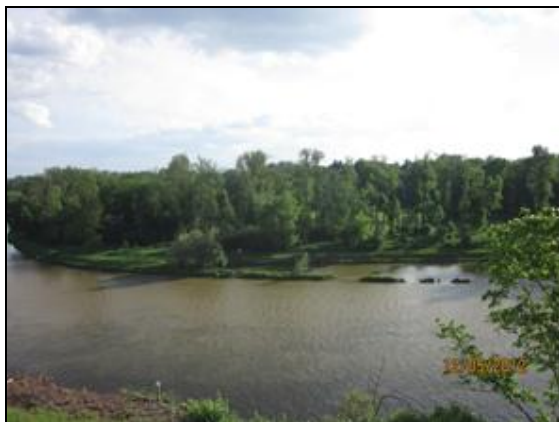
Obr. 6. Pohled na Hořinský park směrem od Mělnického zámku