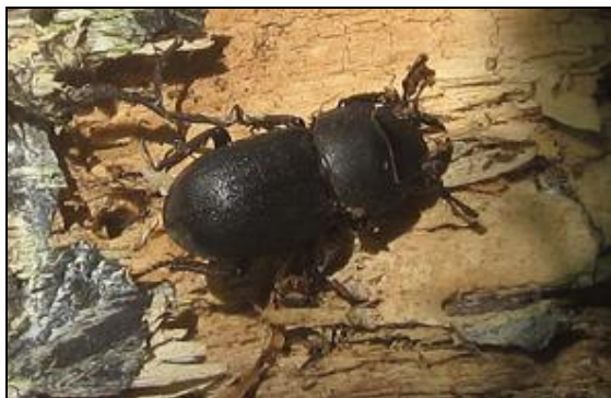
Obr. 1. Samice Dorcus parallelipedus