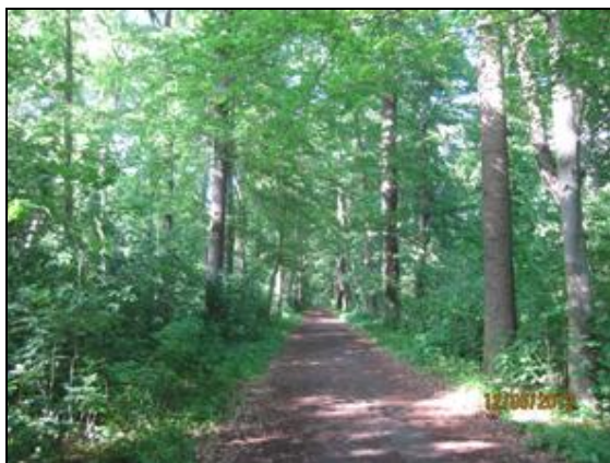
Obr. 8. Cesta od Hořinského zámku k mělnickému mostu