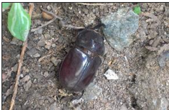
Obr. 3. Samec Oryctes nasicornis ondrejanus