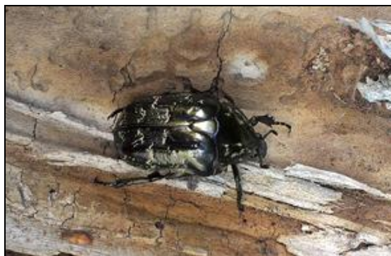
Obr. 4. Samice Protactia marmorata marmorata