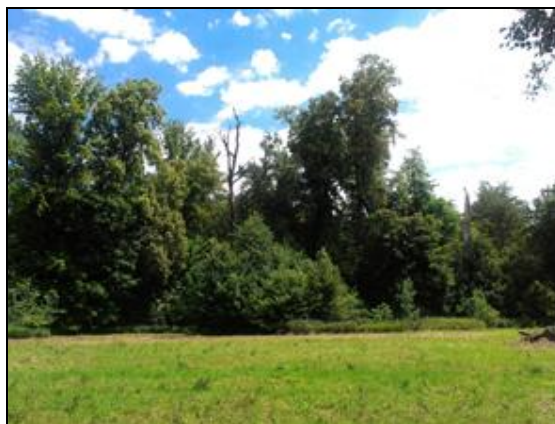
Obr. 9. Druhá část louky u silnice k Brozánkům, pohled směrem k Mělníku