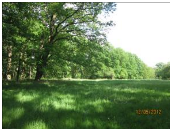
Obr. 7. Jedna část louky směrem od Hořinského zámku k mělnickému mostu